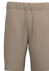
8069 Sandy Hook