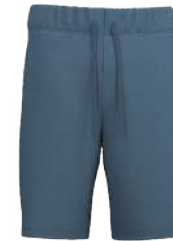
4213 Stone Blue