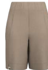
8069 Sandy Hook