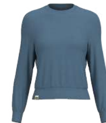
4213 Stone Blue