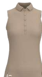
8069 Sandy Hook