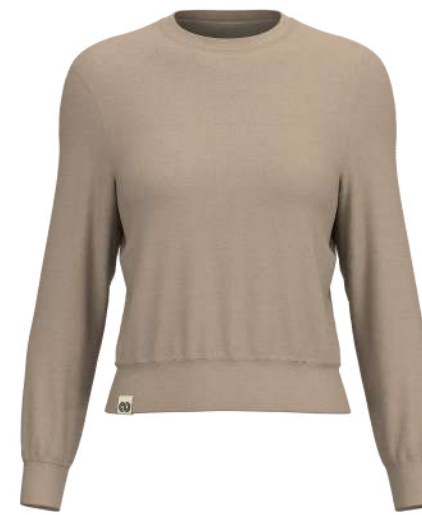
8069 Sandy Hook