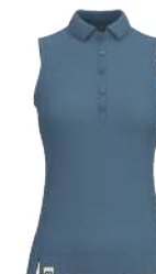
4213 Stone Blue