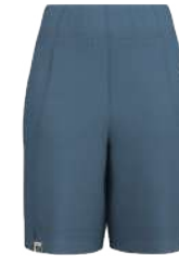
4213 Stone Blue